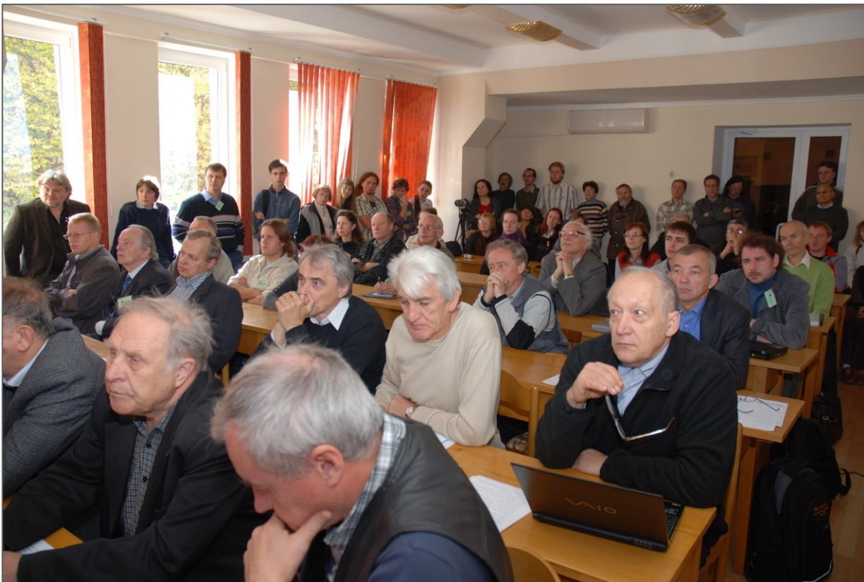
Рис. 1. На защите диссертации. Диссертационный совет Д 002.203.01.