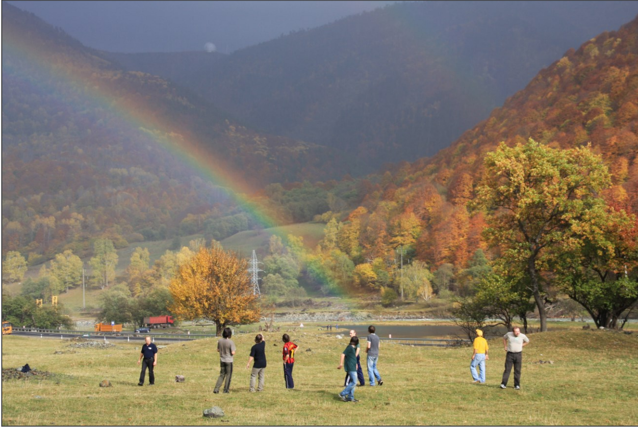
Рис. 4. Всероссийская молодежная астрономическая конференция «Наблюдаемые проявления эволюции звезд». Заключительный выезд.