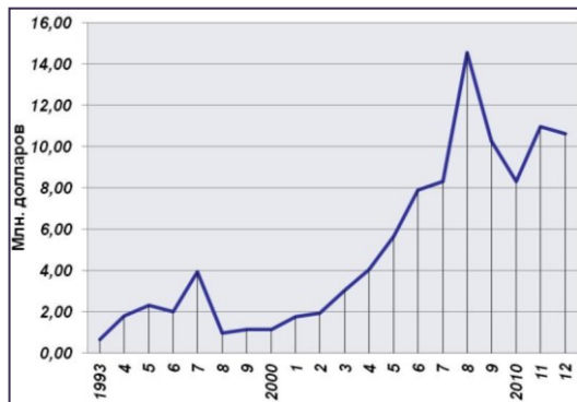
Рис. 7. Полученные обсерваторией средства с 1993 по 2012 гг.

(5) – traveling allowances; (6) – other; (7) – capital construction and repairs; (8) – reconstruction of the 6-m telescope; (9) - corporate property and real estate taxes.